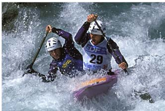
2002 – Revue EPS n°297 Alexandre Falco

L'article d'Alexandre Falco tente explicitement d'intégrer les principes de la Charte des Programmes de 1992. L'enseignement vise à l'acquisition de compétences terminales, validant un certain niveau d'acquisition nécessitant une quantité de pratique importante, pour le moins un cycle long de 20 heures. Selon l'auteur, la compétence articule deux types d'objectifs, celui des connaissances et celui de la socialisation. Plus précisément, les compétences intègrent des connaissances liées à la maîtrise spécifique de l'embarcation, à la